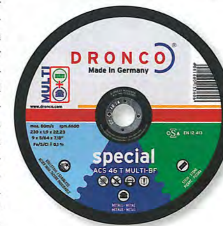
„ASC 46 T Multi“

trennt Stahl, Edelstahl und Stein, insbesondere Wandfliesen „mit einer hervorragen-