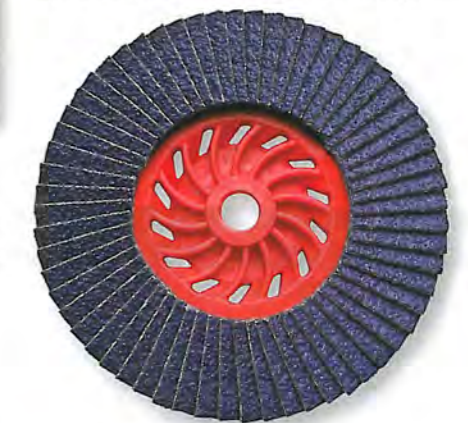
„Flapdisc JET AZA“

„Mit unseren Neuheiten geben wir dem Handel wieder die Möglichkeit, Kunden aktiv auf neue Problemlösungen anzusprechen und auch weitere Zielgruppen zu erreichen“, kommentiert Troesch. Für ihn reicht es nicht aus, die Produkte ins Sortiment aufzunehmen, ohne dies auch zu kommunizieren. Eine „Neuheitenfläche“ an zentraler Position im Geschäft könnte beispiels-